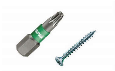
Бита и саморез